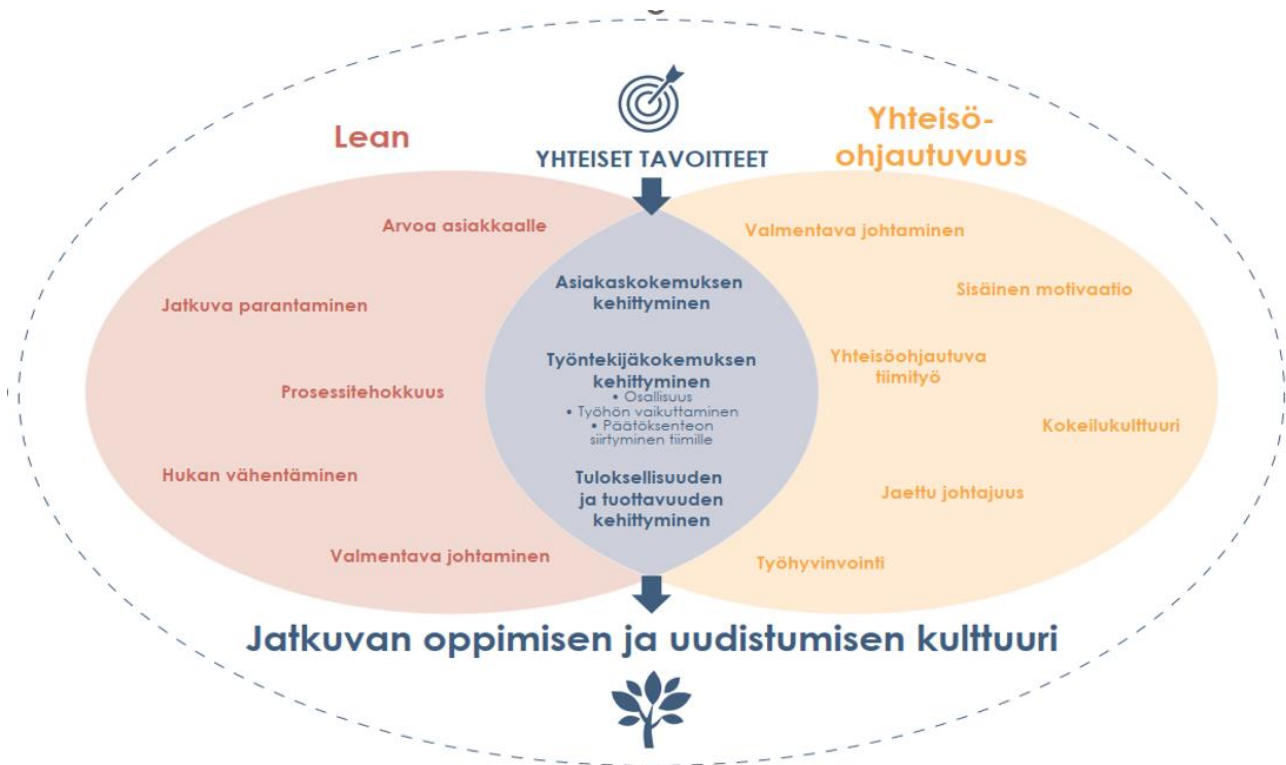
Kuva 38 Leanin ja yhteisöohjautuvuuden tavoitteet

Tavoitteena on tasalaatuinen esihenkilötyö, jonka yksi mahdollistaja on kohtuullinen alaisten lukumäärä. Esihenkilöiden johtamis- ja muutosjohtamisosaamiseen panostetaan KeuAkatemian valmennuskokonaisuuksien avulla. Tavoitteena on valmentava johtaminen ja hyvä työelämän laatu. Hyvinvointialueen palkitsemispolitiikka ja henkilöstöedut tukevat näiden tavoitteiden saavuttamista. Vuosina 2024 - 2025 kiinnitetään erityistä huomioita muun muassa asiakas- ja potilaspolkuihin sekä moniammatillisen osaamisen vahvistamiseen. Näiden arvioinnissa ja kehittämisessä hyödynnetään aktiivisesti leanin jatkuvan parantamisen työkaluja ja prosesseja. Esihenkilöitä ja työyhteisöjä tuetaan yhteisöohjautuvuuden ja leanin toteuttamisessa. Mittareina toimivat Keski-Uudenmaan hyvinvointialueen Syke -kyselyn osa-alueista johtaminen- ja esihenkilötyö sekä prosessit.